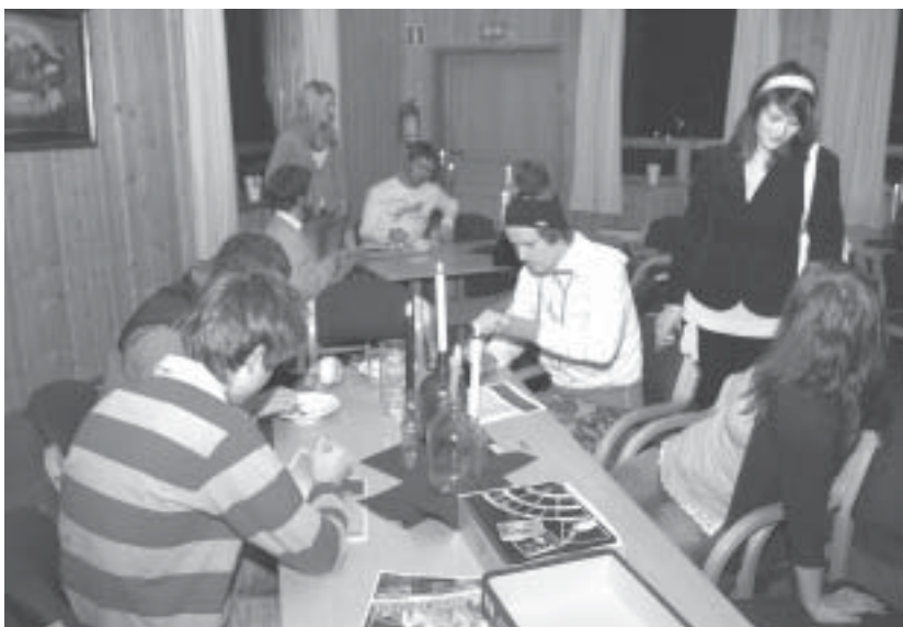
Det smaker godt med skikkelig mat, laget av voksne, på nattkafeen.

Ungdomsklubben på Emaus er populær. Vi var innom en kveld i høst da det var nattkafé.