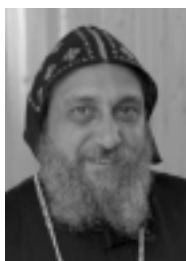
Bispebesøk i Mari s. 6