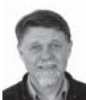
Tormod Berger: Grønn menighet s. 2 og 7