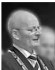
Minneord s. 3.