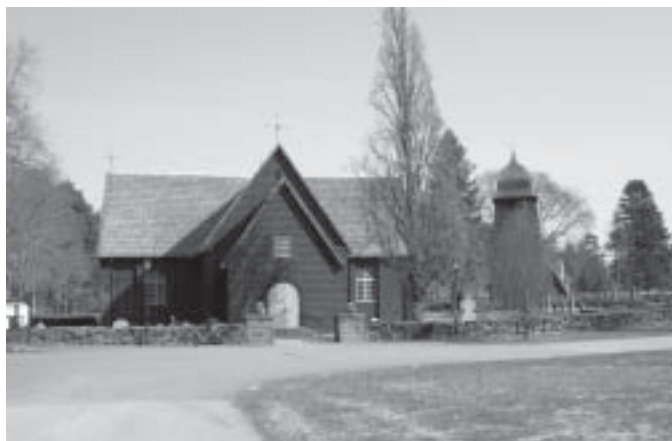
750 år gamle Hammarö kirke