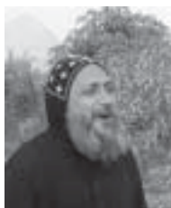
Nytt misjonsprosjekt i Mari