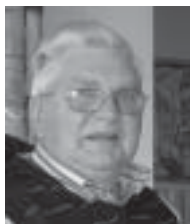
I trofast tjeneste